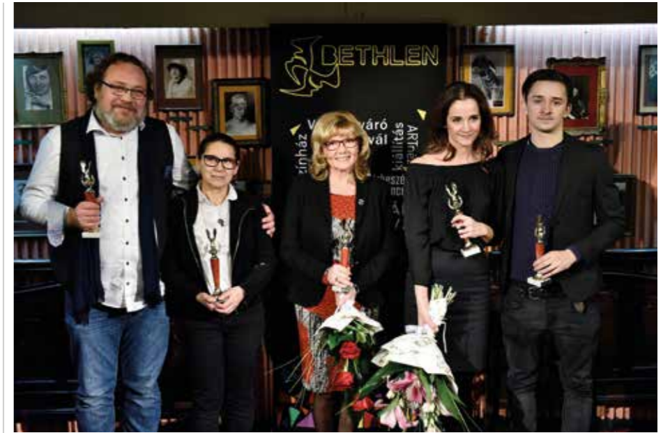
A tavalyi Arany Medál-díj elismert művészei

A voksolás e-mailen keresztül történik, az aranymedaldij@gmail.com címre kell küldeni a díjra érdemesnek tartott művész nevét, október 30. és november 30. között. Minden e-mail számít, és kizárólag az e-mailek számítanak. Nincs lista a jelöltekről, minden olyan színészre, íróra és rendezőre lehet szavazni, aki az idei