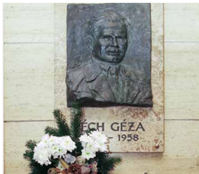
Erzsébetváros 2018. november 15.

szakszerűen, a mentők kiérkezése előtt megkezdhesék az alapszintű újraélesztést. Bízom benne, hogy sikerül felhívni a figyelmet arra, hogy sokszor a legkisebbnek tűnő segítség is életet menthet.