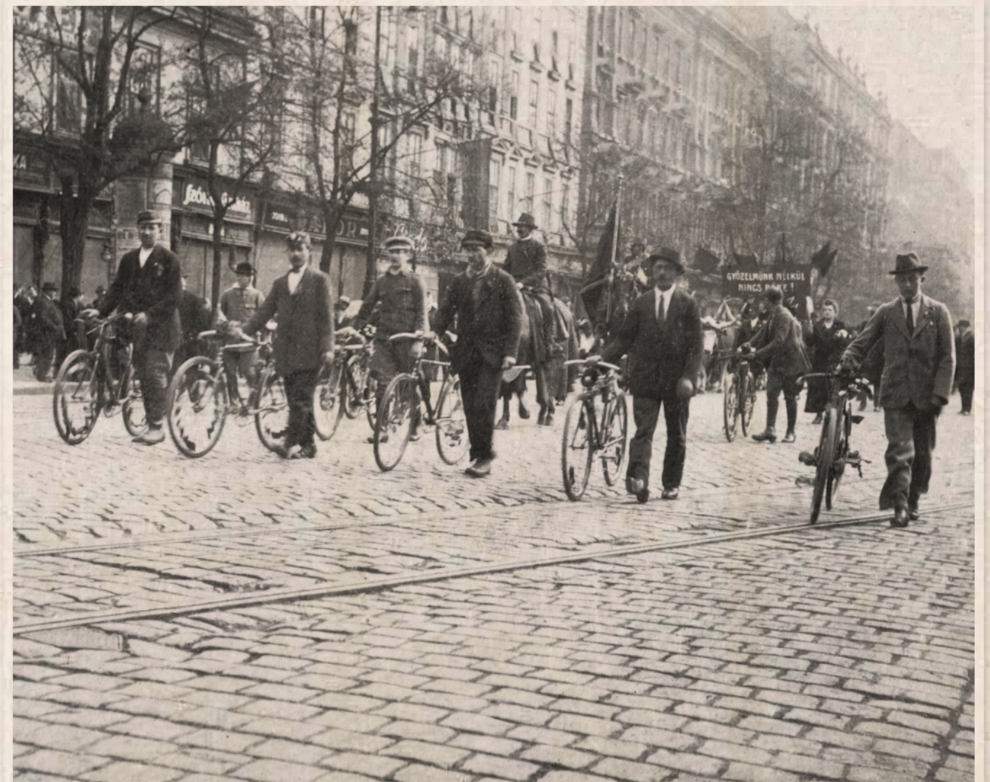
1919. május 1-jei felvonulás a Rákóczi úton.

A kerületi munkástanács harmadik ülésére május 12-én került sor. A megbeszélésen az Intéző Bizottság egyhónapos munkájáról adott jelentést. Elmondták, hogy első lépésként a folyamatban lévő – haszontalan, felesleges – ügyiratok ezreit egyszerűen félretették. Az általuk vezetett hivatal egyszerűsítette az ügyintézését, és 24–48 óras elintézésre redukálták azt. Átszervezték az ügyosztályokat, a munkásság segítése érdekében